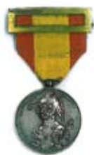
Medalla Conmemorativa del I Centenario de los Sitios de Zaragoza.