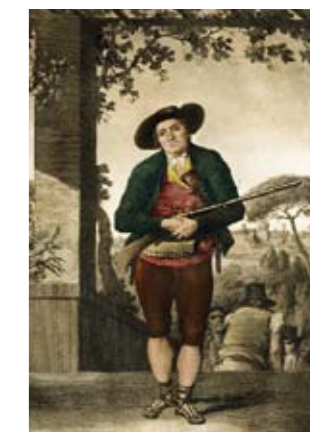
GRABADO DE FERNANDO BRAVILLA

Los Sitios han llegado a ser el paradigma del orgullo patriótico, de quienes defienden lo propio frente a lo impuesto. Napoleón descubrirá en Espa-