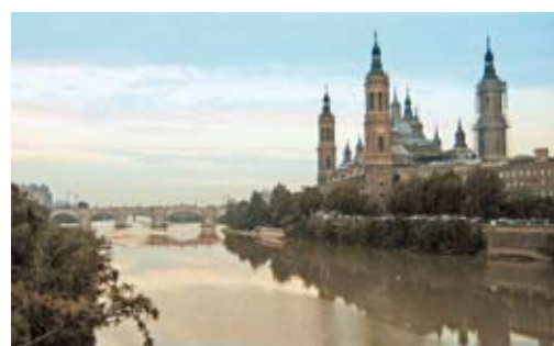
Zaragoza con el puente de Piedra al fondo, único en 1808, que une el Arrabal con la ciudad.