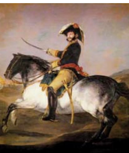
MUSEO DEL PRADO, MADRID

NO SÉ RENDIRME. DESPUÉS DE MUERTO, HABLAREMOS DE ESO contestó Palafox a la petición del General Moncey de que le rindiera Zaragoza.