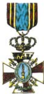
Cruz del 1º y 2º Sitios concedida por Fernando VII.

LÁMINA DEL SERVICIO HISTÓRICO MILITAR. MADRID.