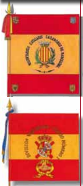
Unidades de voluntarios catalanes (su bandera, de la colección del Castillo de Montjuich, Barcelona) y vascos (bandera según lámina del SHM) combatieron bajo los colores nacionales.