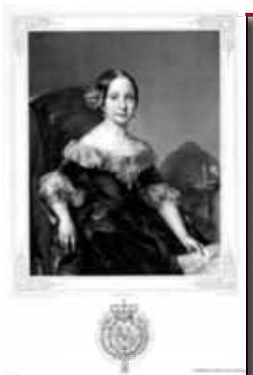
LÁMINA: BIBLIOTECA NACIONAL MADRID