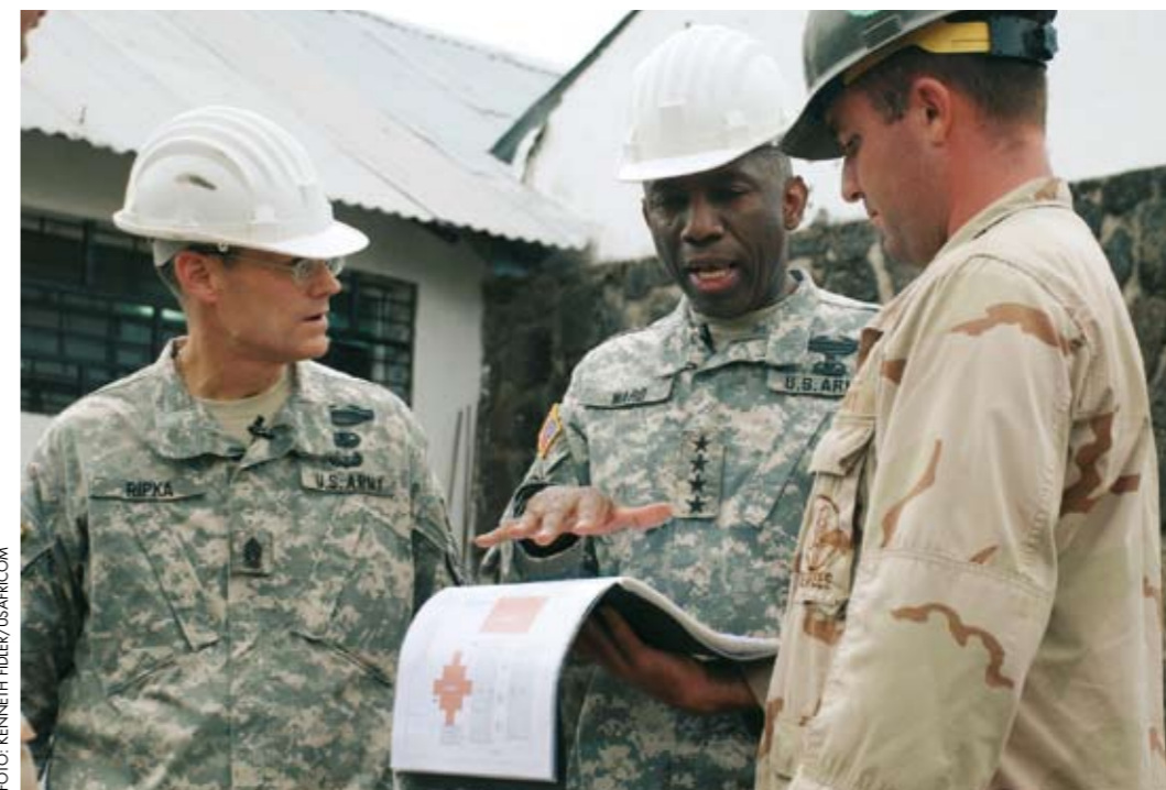
El General William Ward (en el centro), comandante del USAFRICOM, departe con dos ayudantes sobre los detalles para la construcción de una escuela en las Islas Comores. El edificio servirá para dar clase a 250 estudiantes.

La actual aproximación estadounidense a África es continuación de la iniciada bajo la Presidencia de Bill Clinton, aunque desde 2001 incluye también una lucha contra el terrorismo yihadista que ya los atentados contra las Embajadas estadounidenses en Nairobi y Dar es-Salaam, en 1998, empezaron a hacer necesaria. Es consecuente con lo establecido en la Estrategia de Seguridad Nacional norteamericana, aprobada en 2006, que considera al continente "una alta prioridad para los EEUU", clarificando la aún tibia aproximación presente en la Estrategia anterior, de 2002. En términos de lucha antiterrorista, la experiencia de la Iniciativa Pan-Sahel (2002-2005), continuada por la Iniciativa Trans-Sahariana Contraterrorista (TSCTI, en sus siglas en inglés, de 2005 a 2009) y el activismo antiterrorista en el Cuerno de África, constituyen dos pilares fundamentales del USAFRICOM. La aproximación hacia el Magreb y el Sahel ha tenido en el General de cuatro estrellas William E. Kip Ward, el militar negro de más alta graduación en las Fuerzas Armadas estadounidenses, a uno de sus principales artífices, con experiencia