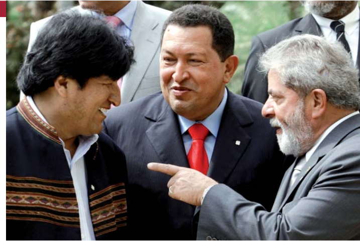
El Presidente de Brasil, Luiz Inácio Lula da Silva, a la derecha, habla con sus homólogos de Bolivia, Evo Morales, y Venezuela, Hugo Chávez (en el centro), en una reunión en 2007.

En tanto en cuanto en este momento en América Latina toda aspiración de liderazgo ha de ir acompañada de una propuesta de integración, cabe destacar la creación de la UNASUR, producto de una iniciativa brasileña. Esta organización se formalizó en mayo de 2008 y está compuesta por 12 países sudamericanos (Argentina, Bolivia, Brasil, Chile, Colombia, Ecuador, Perú, Paraguay, Uruguay, Venezuela, Surinam y Guyana). A ello habría que agregar la creación, en el seno de esta organización, del Consejo de Defensa Sudamericano, en la reunión extraordinaria de la UNASUR que también tuvo lugar en el mes de diciembre en Brasil. Junto a ésta se celebraron tres cumbres más una de MERCOSUR, otra del Grupo de Río y la primera Cumbre de América Latina y el Caribe (CALC). En