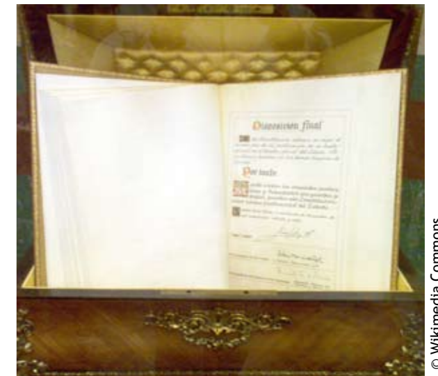
Ejemplar de la Constitución española de 1978, en el Congreso

De ahí probablemente la supresión de los antiguos artículos 2, sobre el mando supremo del Rey, el 3 sobre la misión de las Fuerzas Armadas “garantizar la defensa e independencia de España...”, el 4 sobre el deber de defensa de todos los españoles ,la segunda parte del 27 “...aunque exijan sacrificios y aun la misma vida en defensa de la patria”, que figura en el artículo 3 de la Ley de Régimen de personal, en el juramento o promesa ante la Bandera.